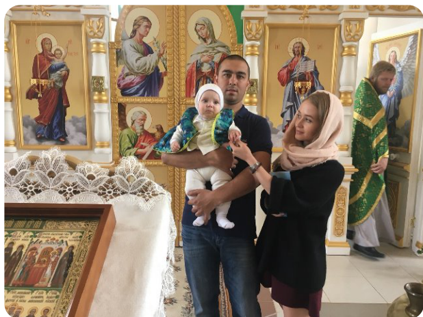
В храме священноисповедника Иоанна Оленевского совершилось таинство Крещения

Кроме прихожан храма, в молебне приняли участие паломники из Пензы. Традиционно всем молящимся были розданы распечатанные тексты акафиста Пресвятой Богородицы.