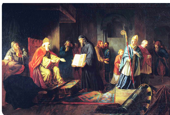
Великий князь Владимир выбирает веру. Эггик И.Е., 1822 г.

Культуру языческой Руси незачем ни принижать, ни романтизировать. Она была не «выше» и не «ниже», чем дохристианская